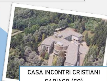
CASA INCONTRI CRISTIANI CAPIAGO (CO)

Come sempre la metodologia formativa sarà essenzialmente laboratoriale.